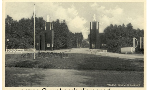
entree Ouwehands dierenpark

Ik zie nog de plek voor me waar ik het eerste slachtoffer zag. Hij was getroffen door een granaat. Ik zal er verder niets over schrijven. We gingen er allemaal met een boog en met de schrik in de benen omheen. Ik zat nogal wat verder naar voren en ging ongeveer bij de ingang van het dierenpark achteruit tot ik weer bij het open veld kwam. Als je doorliep kwam je in Achterberg uit.